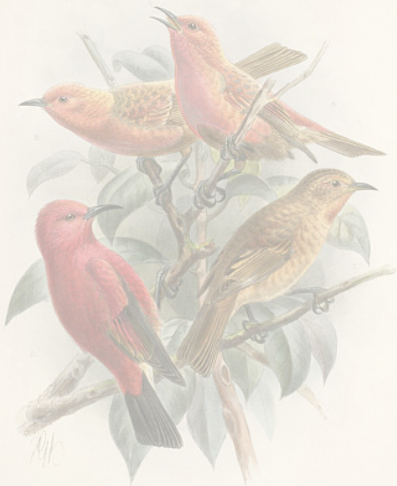
HIMATIONE FRAITHII, ROBERTSII. A ♀ AD. B ♀ AD. C JUV. HIMATIONE SANGUINEA. (♀ ad.) D ♀ AD.